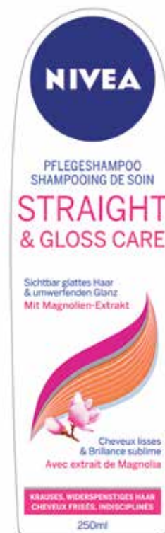
Przykładowy nadruk etykiety Nivea o „większej wydajności”

Aby uwzględnić wszystkie wymagania różnych klientów i potrzeby w zakresie indywidualnych procesów, w każdej kategorii twardości pianki udostępniamy cztery różne serie taśm samoprzylepnych.