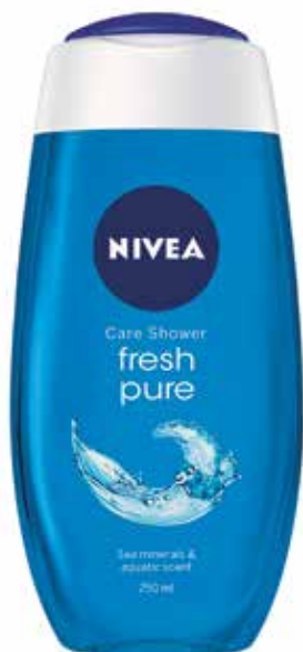
Przykładowy nadruk etykiety „niewidocznej”

używanej taśmy do mocowania płyt. Opracowaliśmy idealne rozwiązanie do drukowania „niewidocznych” etykiet samoprzylepnych. Aby uzyskać doskonałe wyniki w przypadku druku aplowego, wymagany jest określony poziom twardości w połączeniu z wyjątkową wytrzymałością komórek pianki.